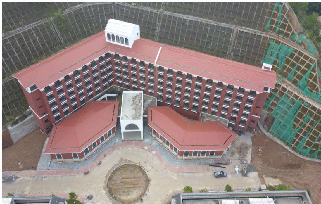
（三期 7#职业培训楼施工鸟瞰图）