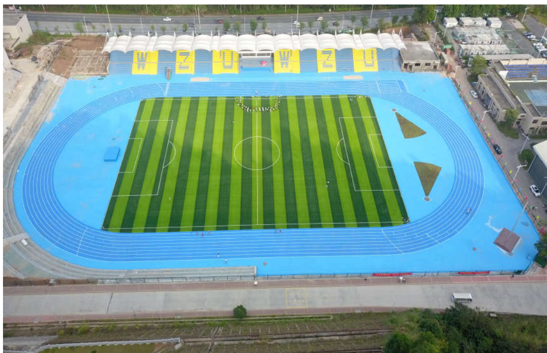
（三期室外运动场及体育看台的施工鸟瞰图）

3. 截止 2023 年 12 月 31 日，本项目累计完成建安产值约 5.82 亿元，已付承包方工程进度款约 4.745 亿元（包含设计费 10108620 元）。