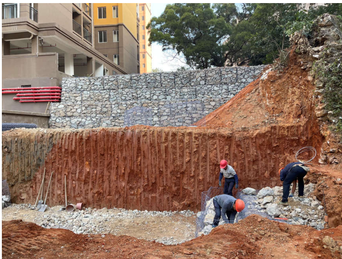
（光华市政工程施工现场）

本月，光华片区市政工程完成了西边围墙的砌筑和批灰，铺设道路水泥稳定碎石，现场排水管道的开挖及安装，保安室基础开挖等工作；教师公租房东侧挡土墙的砌筑完成80%，路缘石铺设完成10%，正在开展水稳层的铺设。