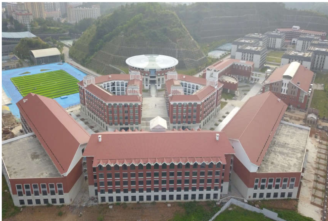
（1#综合教学楼、1#实验实训楼及 1#阶梯教室鸟瞰图）