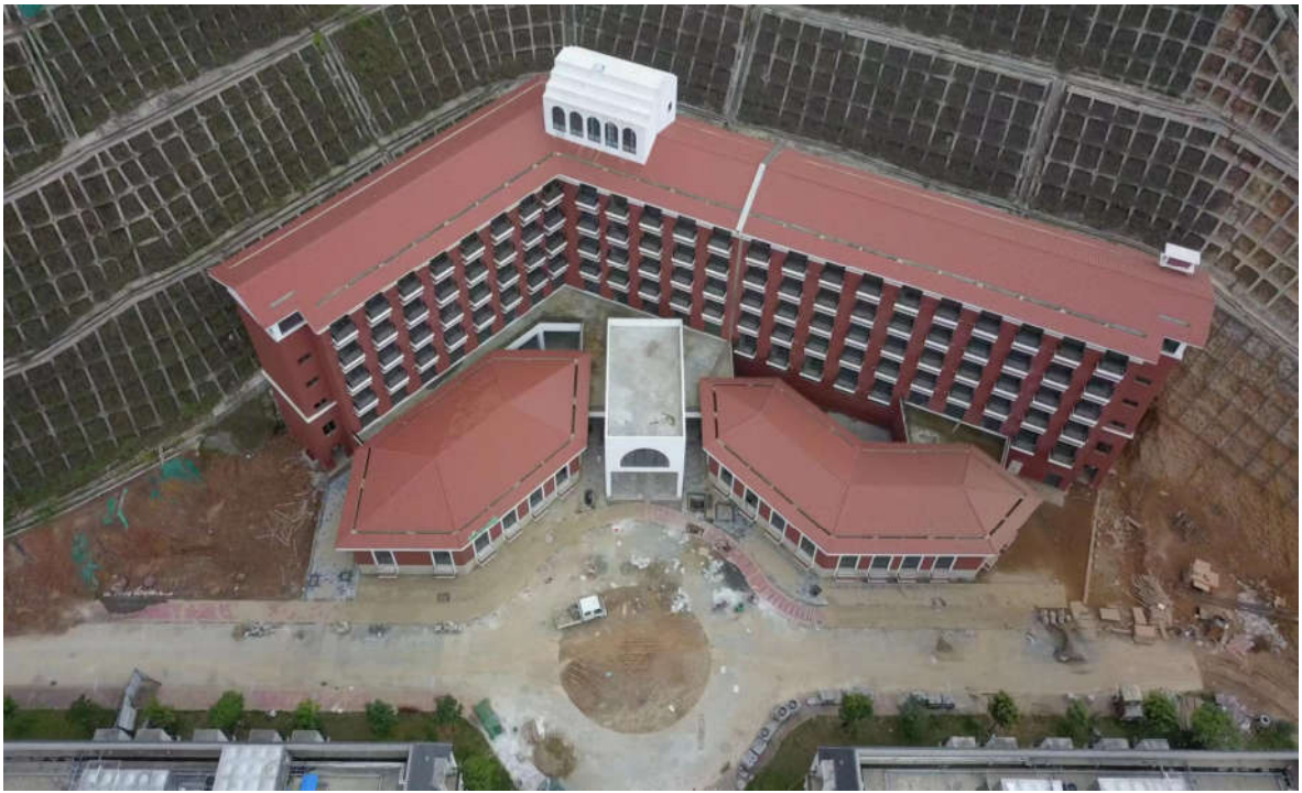
（三期 7#职业培训楼施工鸟瞰图）