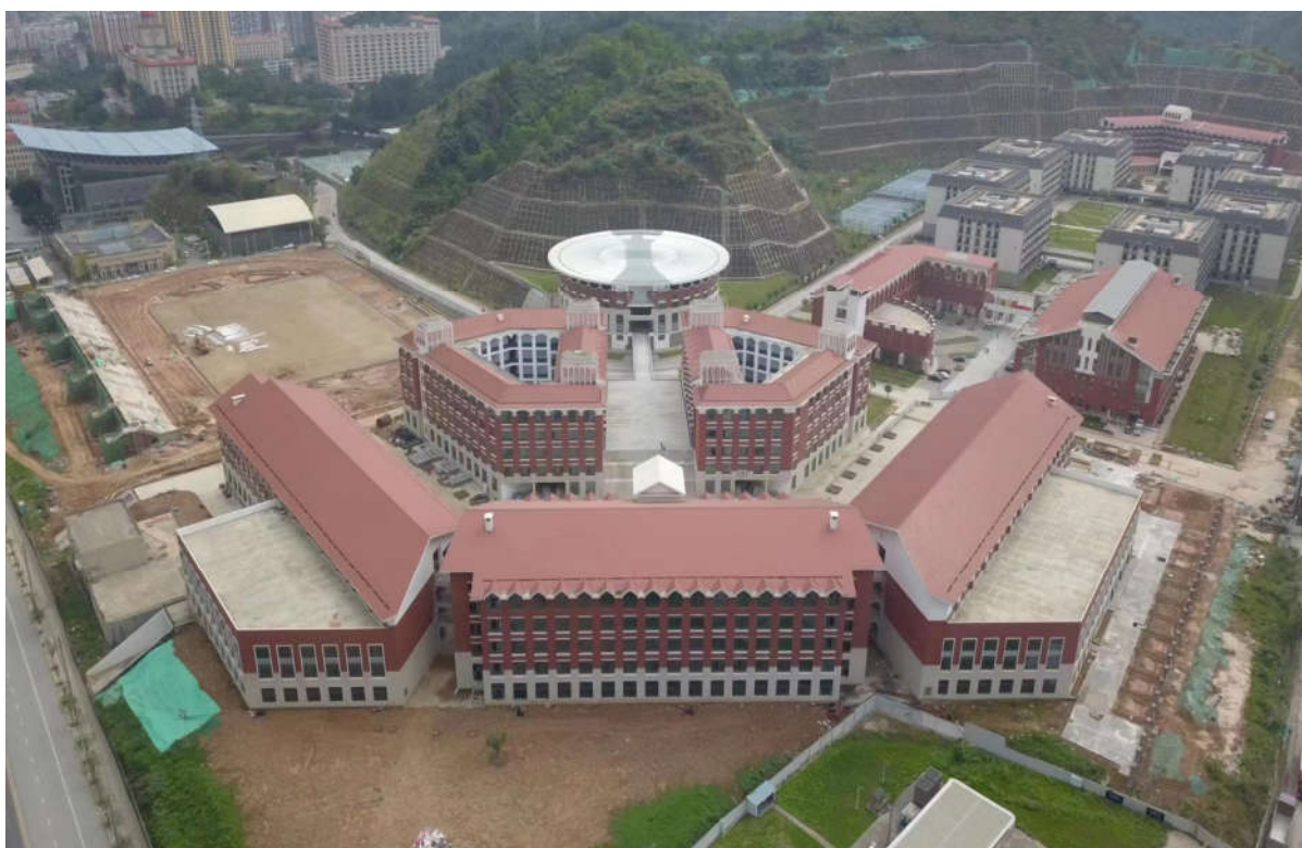
（1#综合教学楼、1#实验实训楼及 1#阶梯教室鸟瞰图）