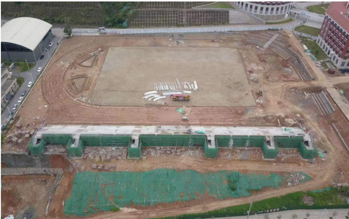
（三期室外运动场及体育看台的施工鸟瞰图）

3. 截止 2023 年 4 月底，本项目累计完成建安产值约 5.73 亿元，已付承包方工程进度款约 4.69 亿元（包含设计费 10108620 元）。