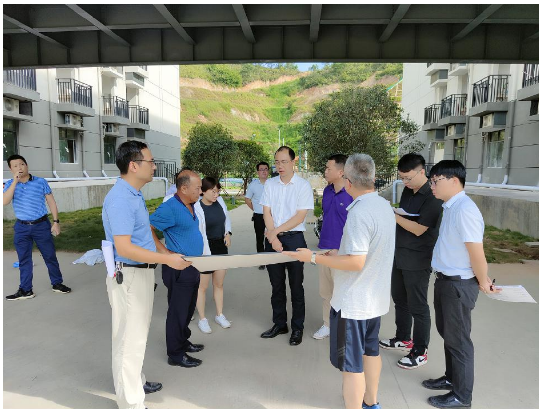
（自治区发改委督导组在北校区调研）

督导组一行深入北校区工地实地查看，听取了项目进展汇报，询问项目前期审批、招投标办理、存在困难、资金到位及支付等情况，对项目实施进展给予充分肯定，强调要充分发挥项目单位主体责任和行业监管责任，在程序规范、保证安全的前提下，加快工程进度，尽快发挥政府专项债券资金的民生效益。