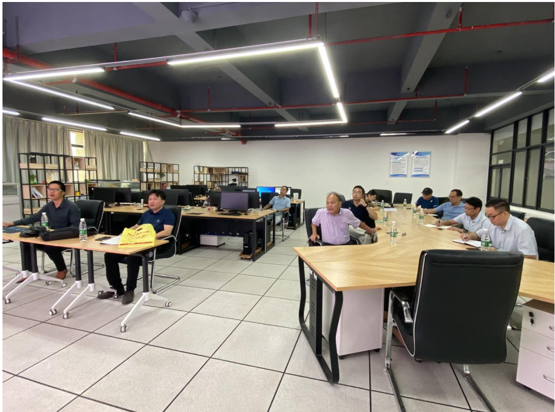
（仁爱湖侧排水渠检查评估报告论证会）