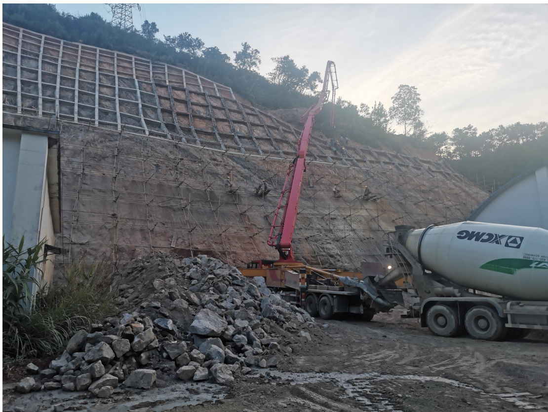
（巨冲地质灾害治理项目）