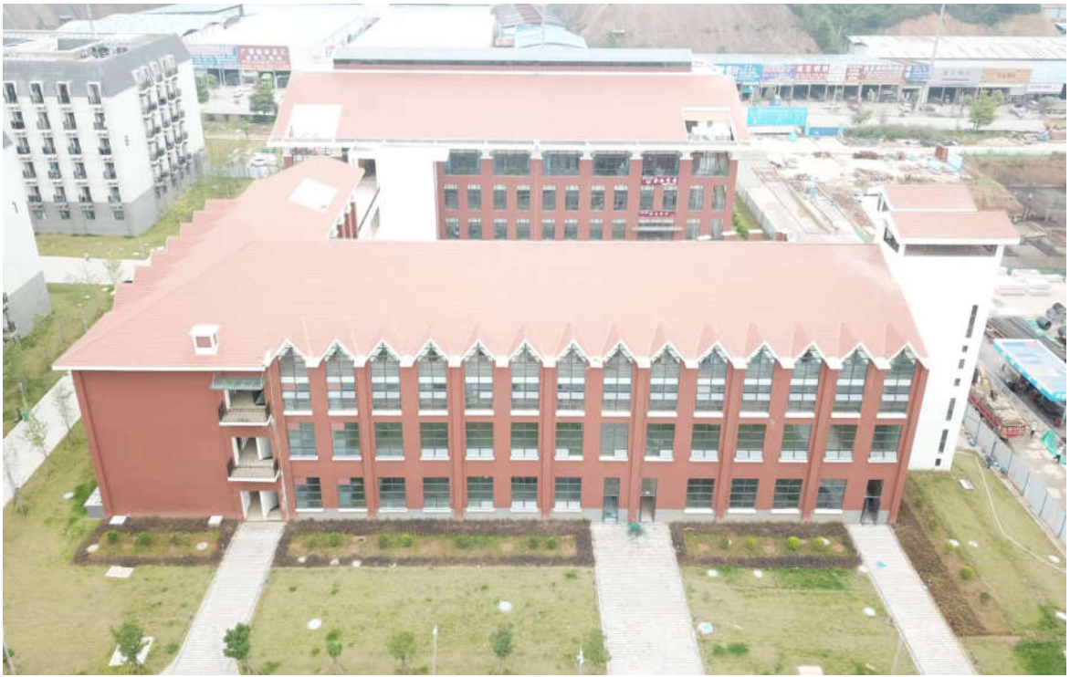
(食堂综合楼鸟瞰图)