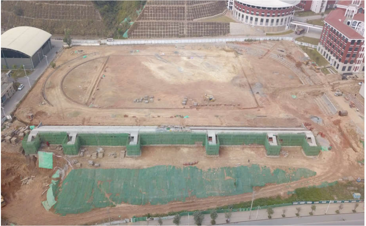
（三期室外运动场及体育看台的施工鸟瞰图）

3. 截止 2023 年 2 月 28 日，北片区项目累计完成建安产值约 5.73 亿元，已付承包方工程进度款约 4.69 亿元（包含设计费 1011 万元）。