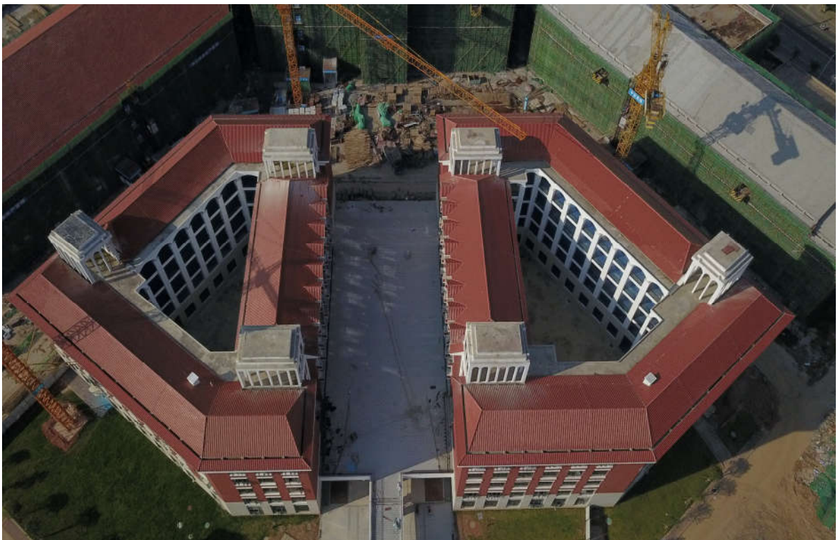
(二期 1#综合教学楼施工鸟瞰图)