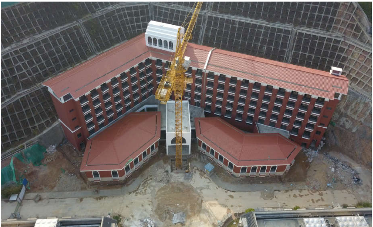
(三期 7#职业培训楼施工鸟瞰图)