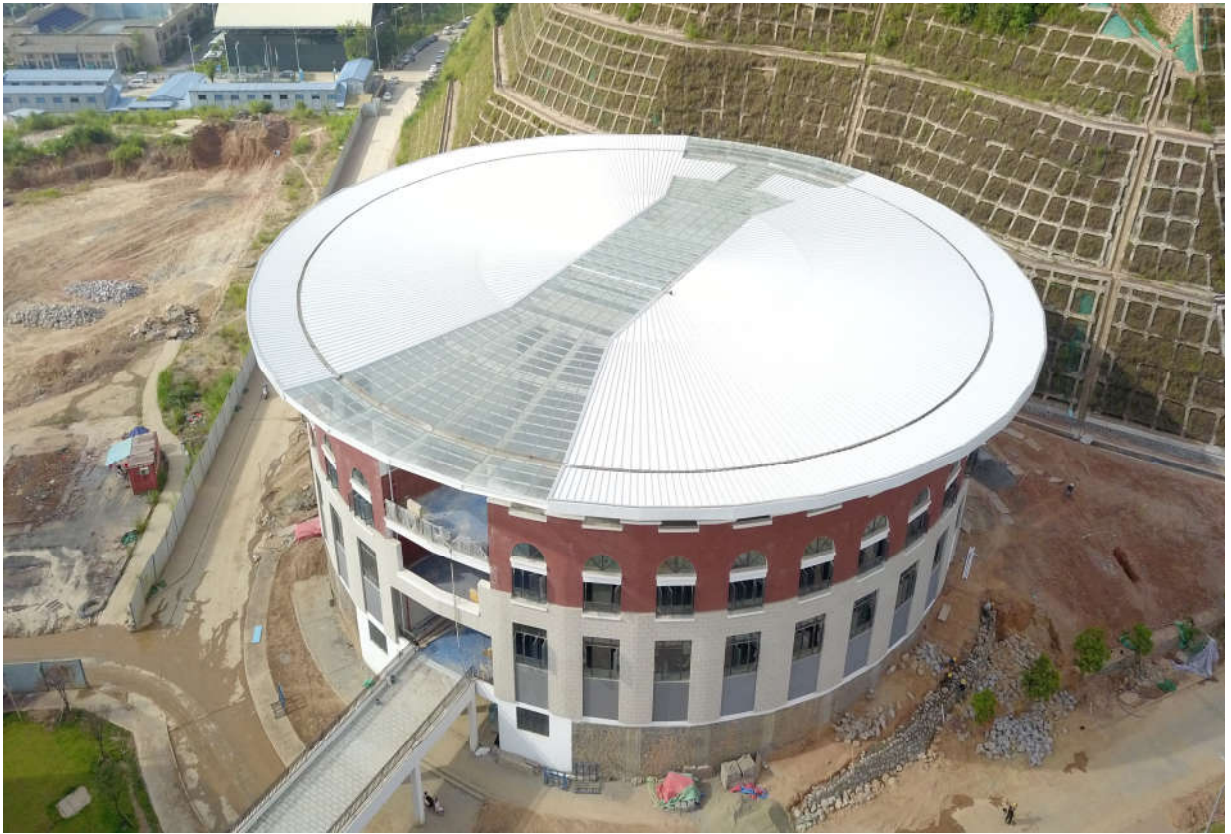
(二期 1#阶梯教室施工鸟瞰图)