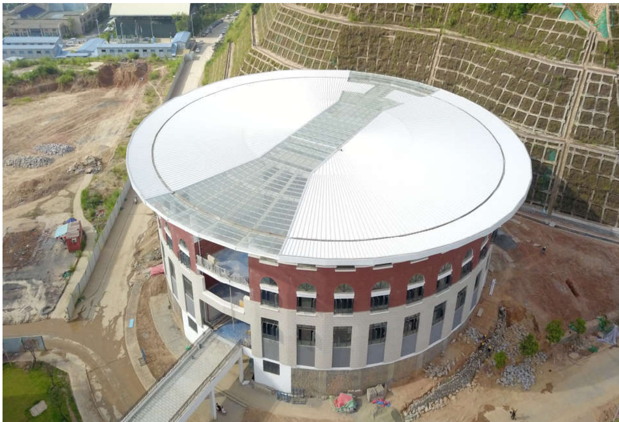
(二期 1#阶梯教室施工鸟瞰图)