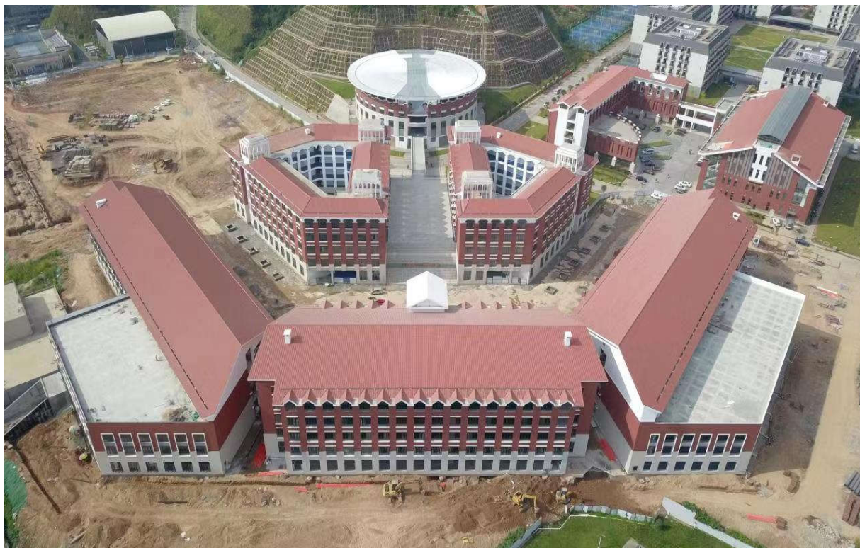
（1#综合教学楼、1#实验实训楼及 1#阶梯教室鸟瞰图）

1. 设计完成情况：北片区初步设计已报区发改委审批；正在办理项目三期的工程规划许可证。