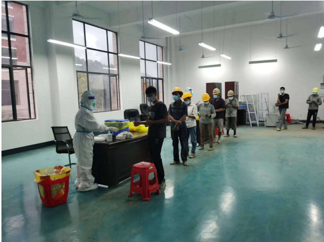
(北片区工地核酸检测现场)

轮核酸检测，确保“应检尽检”。疫情就是命令，防控就是责任，基建攻坚指挥部将持续深化项目工地防疫防控安全工作，联结各方，科学防治，为师生员工的生命健康保驾护航。