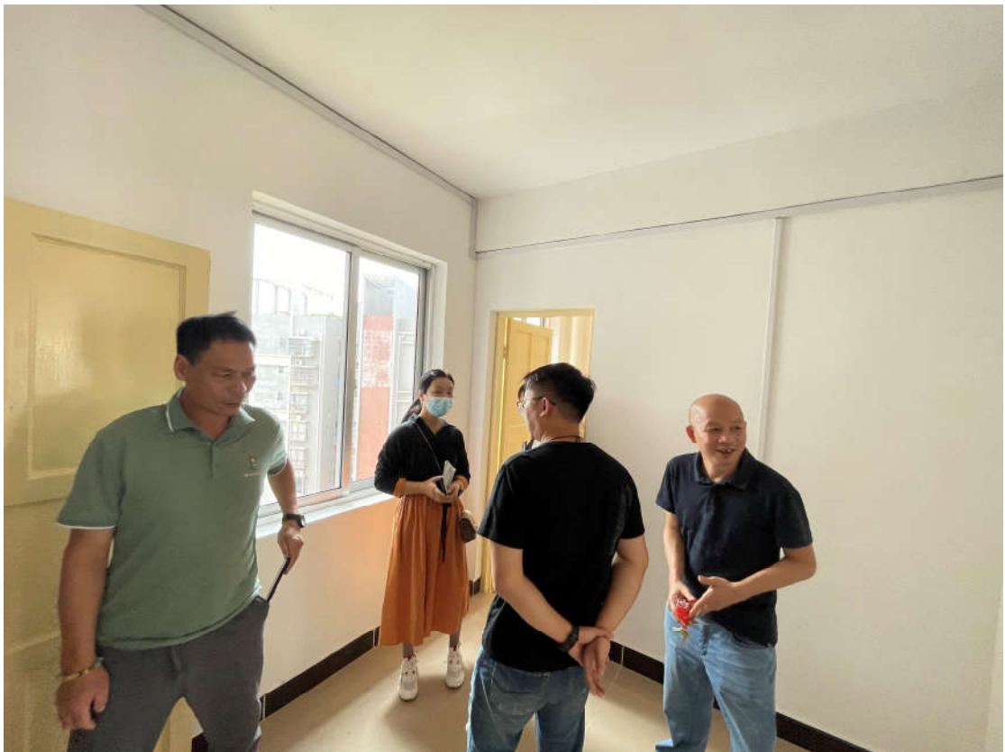
（教师公租房节能验收现场）