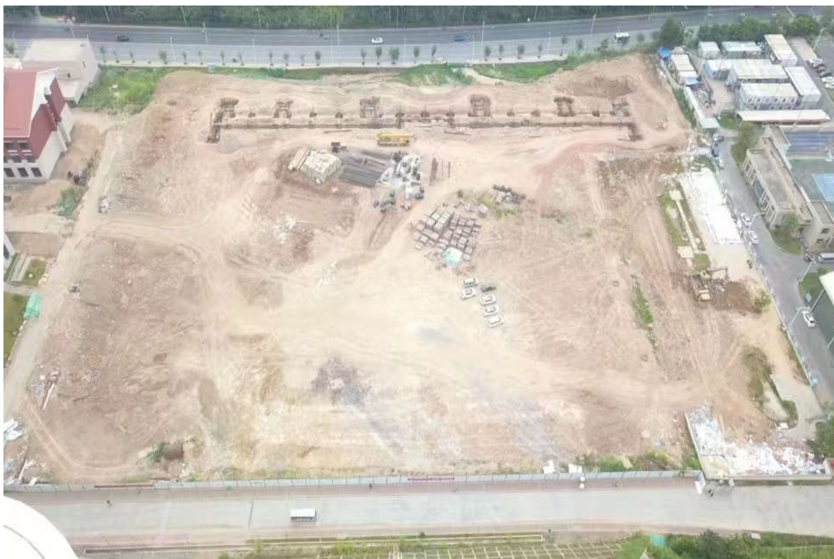
（三期室外运动场平整后及体育看台的施工鸟瞰图）

3. 截止 2022 年 9 月 28 日本项目累计完成建安产值约 5.73 亿元，已付承包方工程进度款约 4.69 亿元（包含设计费 10108620 元）。