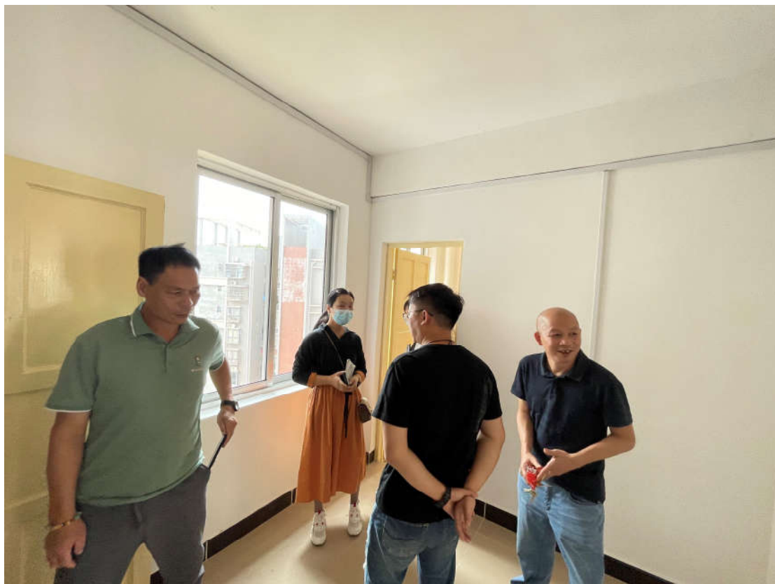
（教师公租房节能验收）