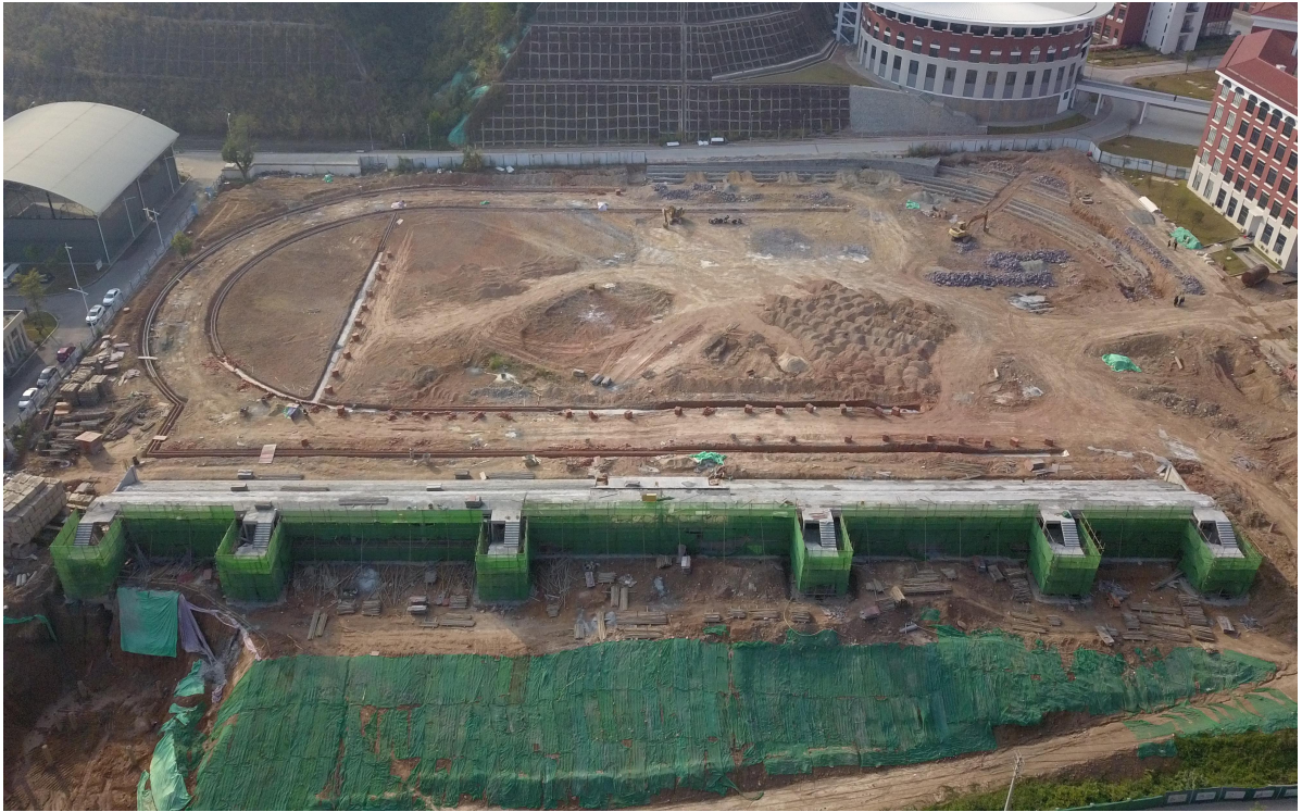
（三期室外运动场平整后及体育看台的施工鸟瞰图）

3. 截止 2022 年 12 月 31 日本项目累计完成建安产值约 5.73 亿元，已付承包方工程进度款约 4.69 亿元（包含设计费 10108620 元）。