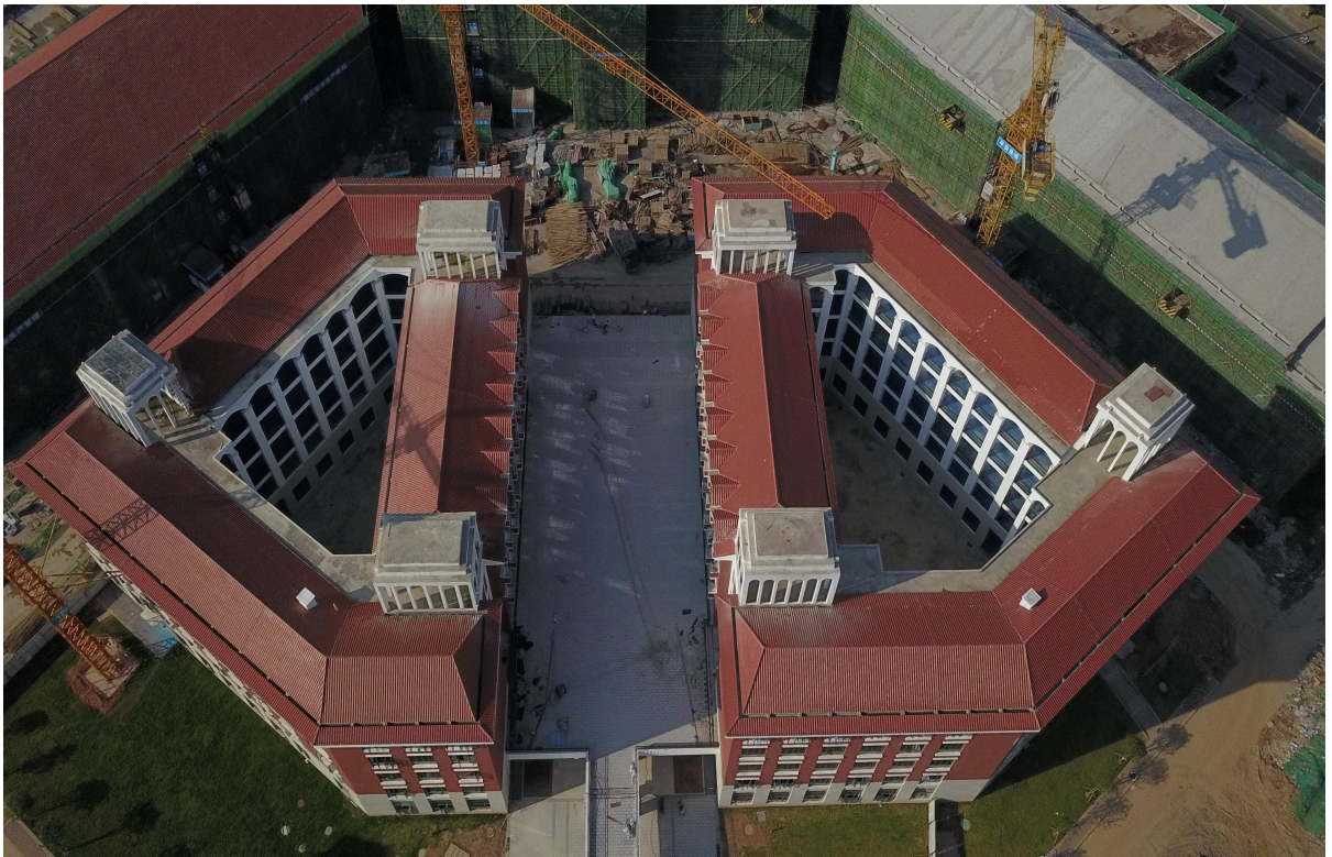
(二期 1#综合教学楼施工鸟瞰图)