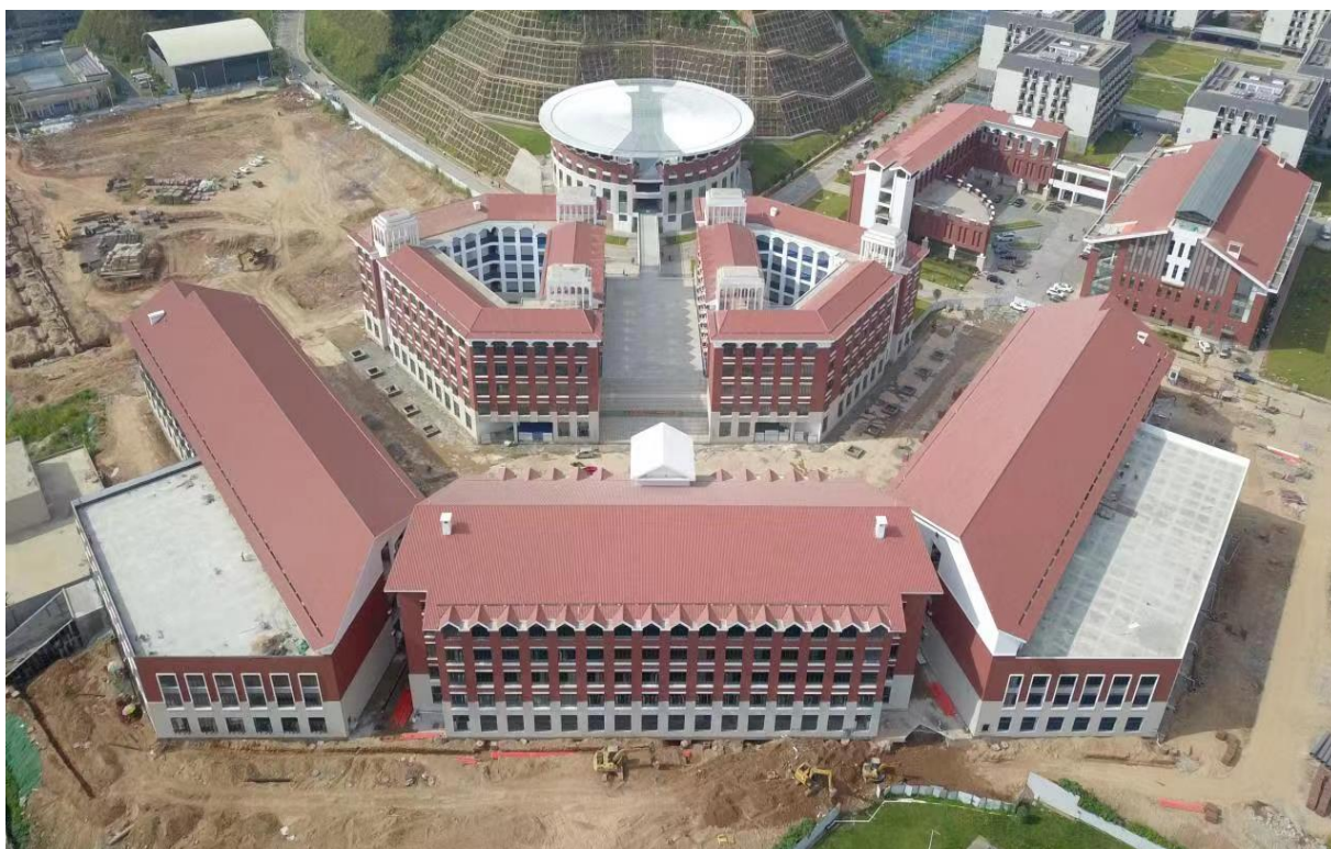
（1#综合教学楼、1#实验实训楼及 1#阶梯教室鸟瞰图）

1. 设计完成情况：北片区初步设计已报自治区区发改委审批；我校已取得北片区三期项目工程规划许可证，三期项目施工许可证正在审批。