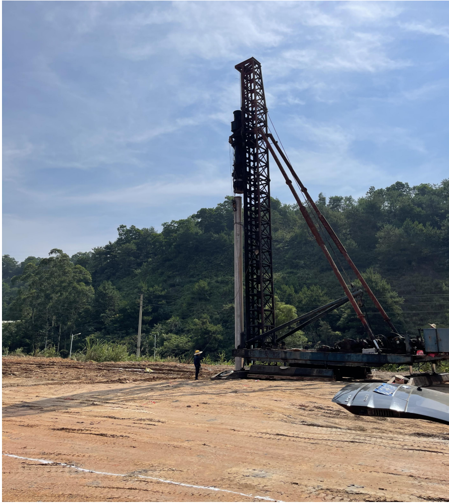
（三期体育场看台及垃圾收集站打桩施工图）