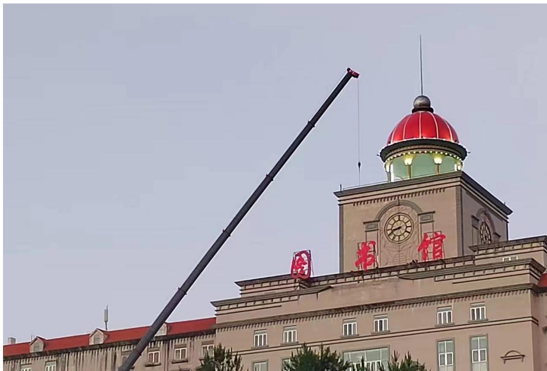
(图书馆穹顶修葺工程)