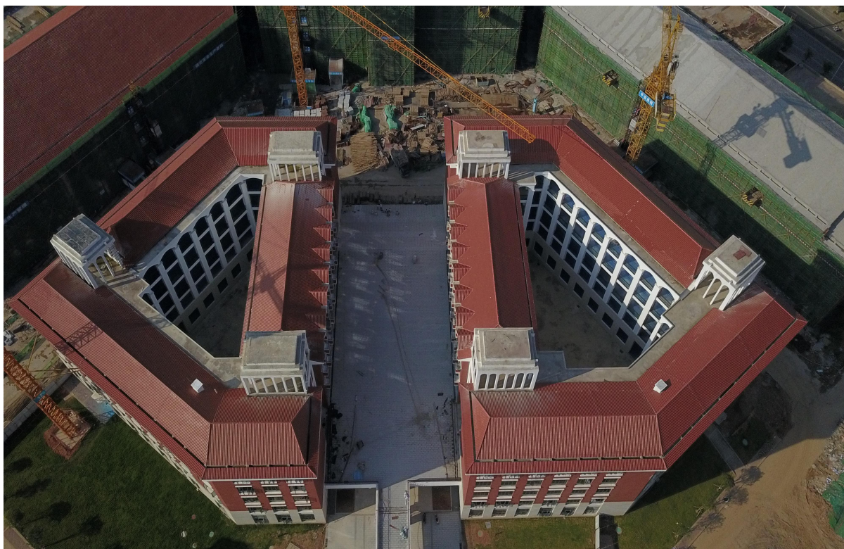
(二期 1#综合教学楼施工鸟瞰图)