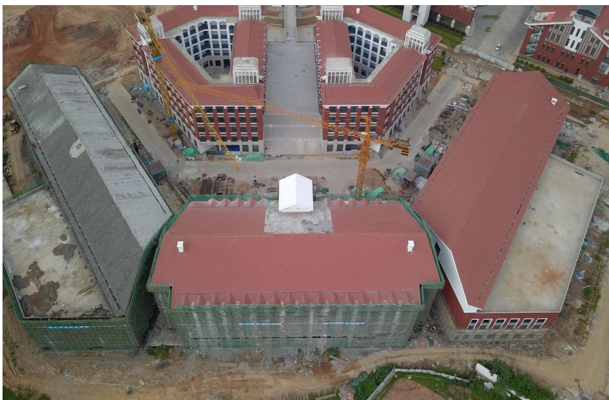
(二期 1#实验实训楼施工鸟瞰图)