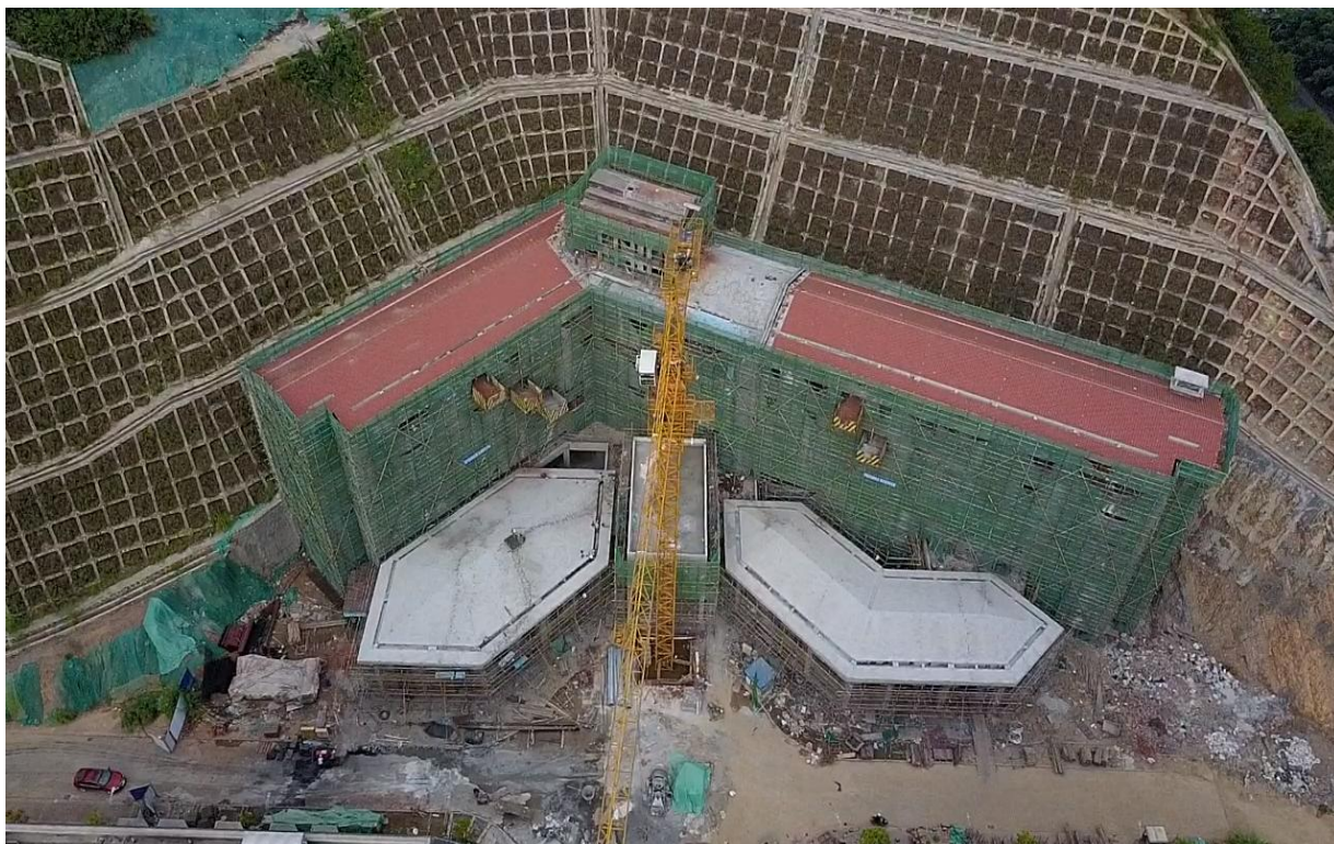
(三期 7#职业培训楼施工鸟瞰图)