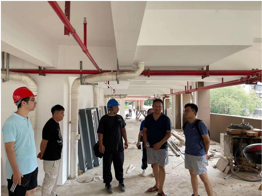
（教师公租房和留学生公寓外线路接入工程验收）