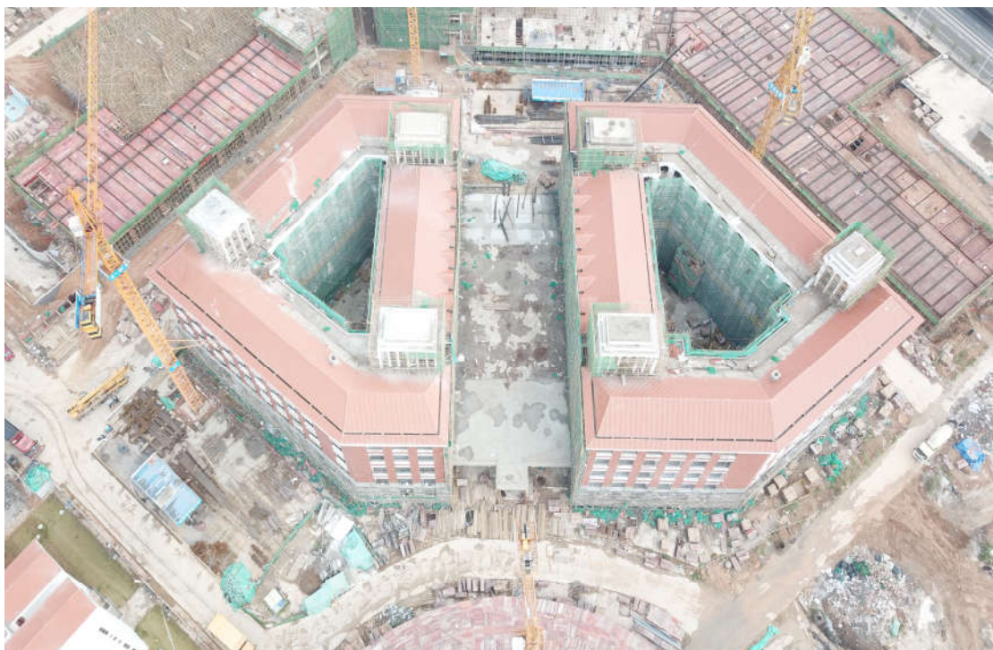
(二期 1#综合教学楼施工鸟瞰图)