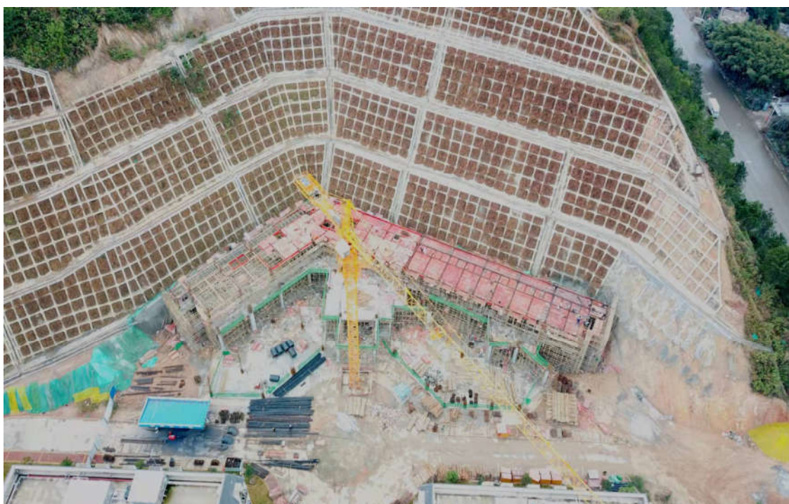
(三期 7#职业培训楼施工鸟瞰图)