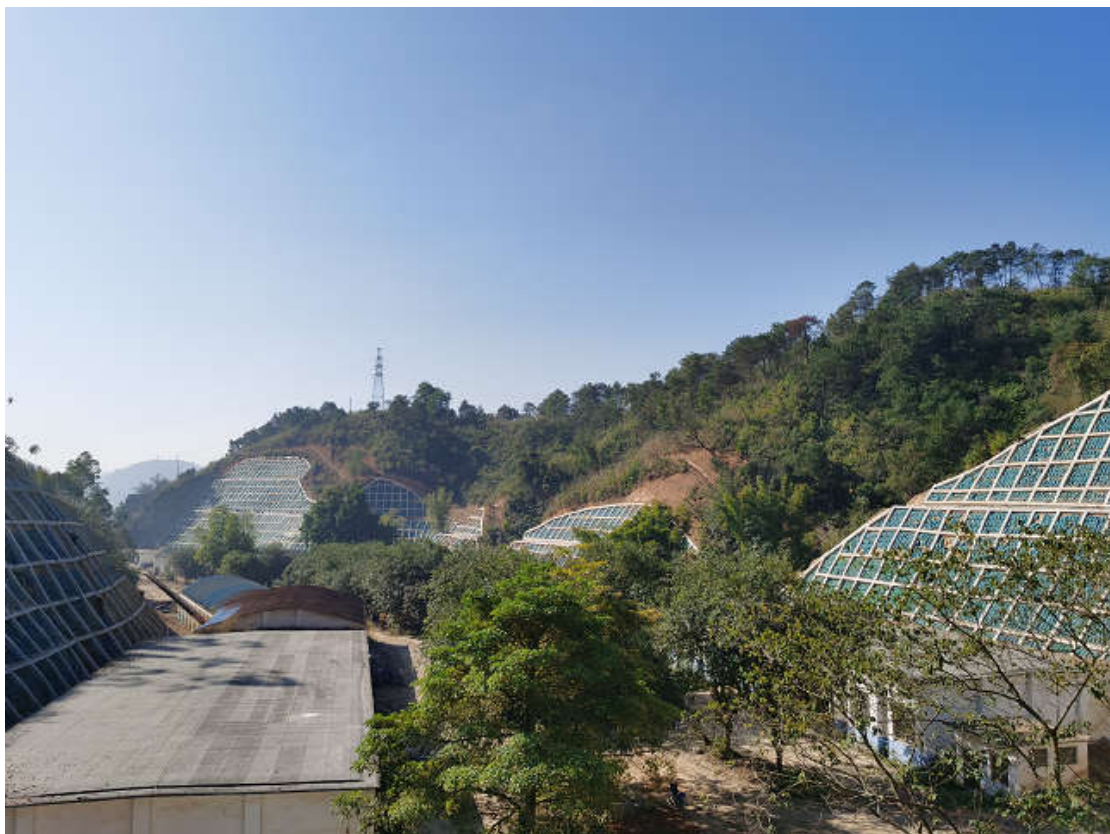
(旦冲边坡地灾治理)