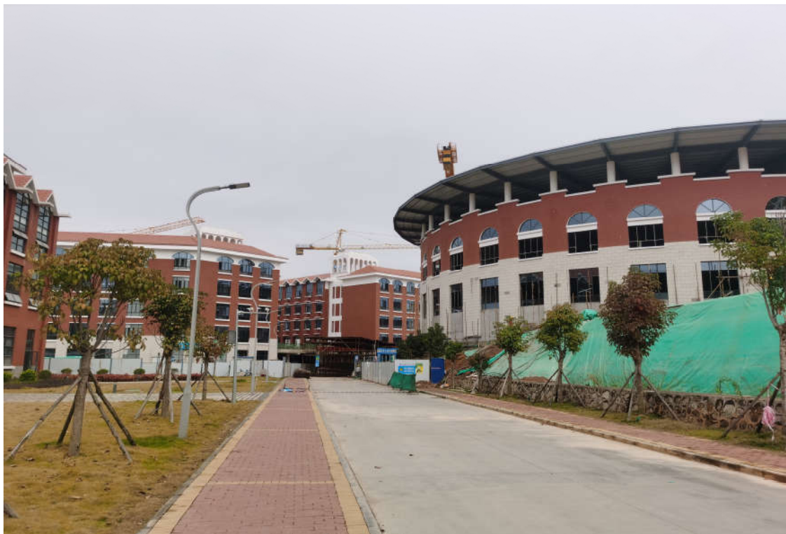
(二期 1#阶梯教室施工图)