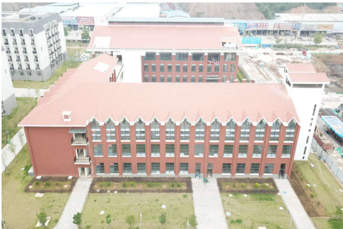
(食堂综合楼鸟瞰图)