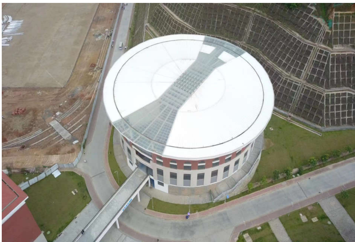
(二期 1#阶梯教室施工鸟瞰图)