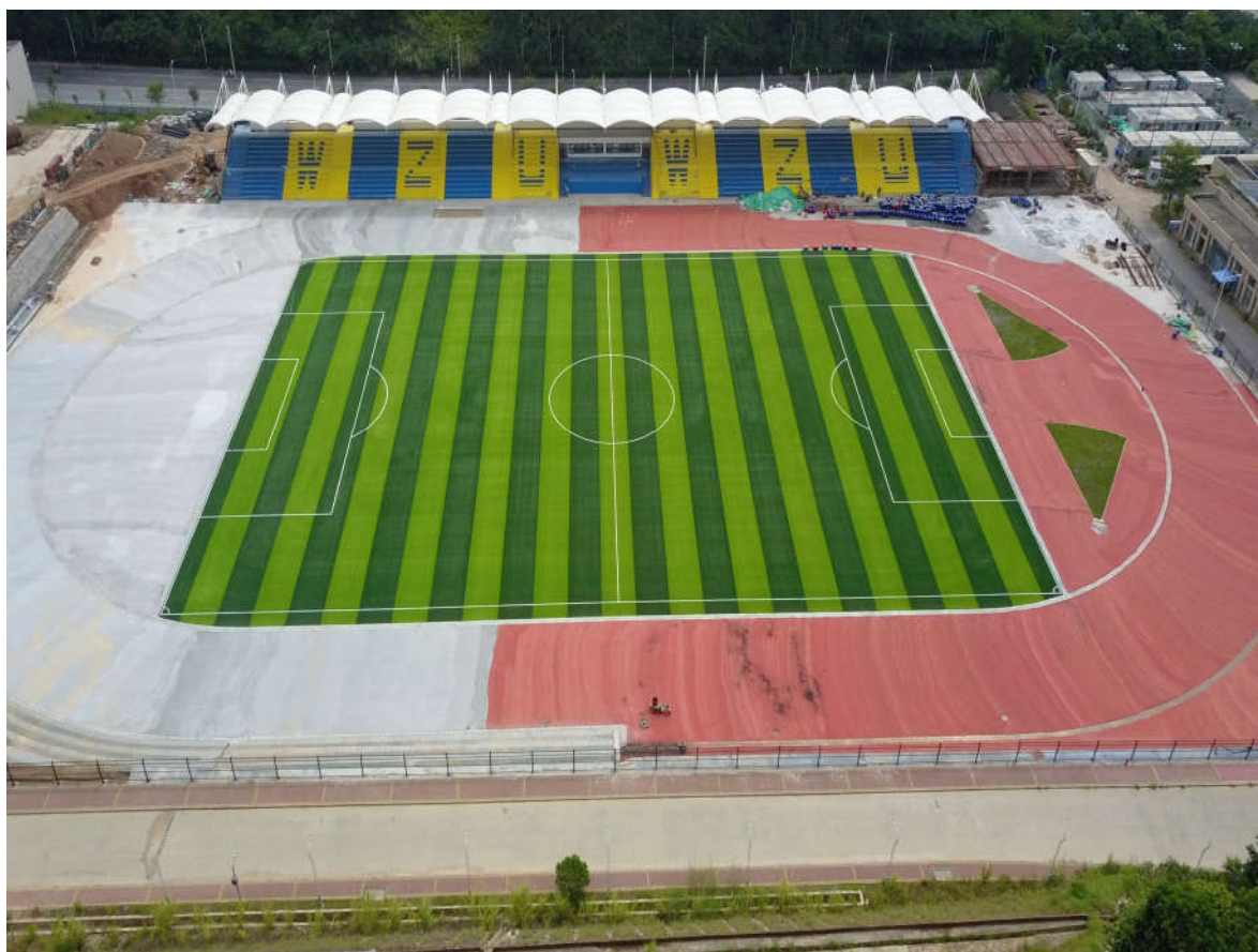
（三期室外运动场及体育看台的施工鸟瞰图）