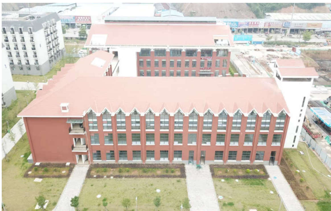
(食堂综合楼鸟瞰图)