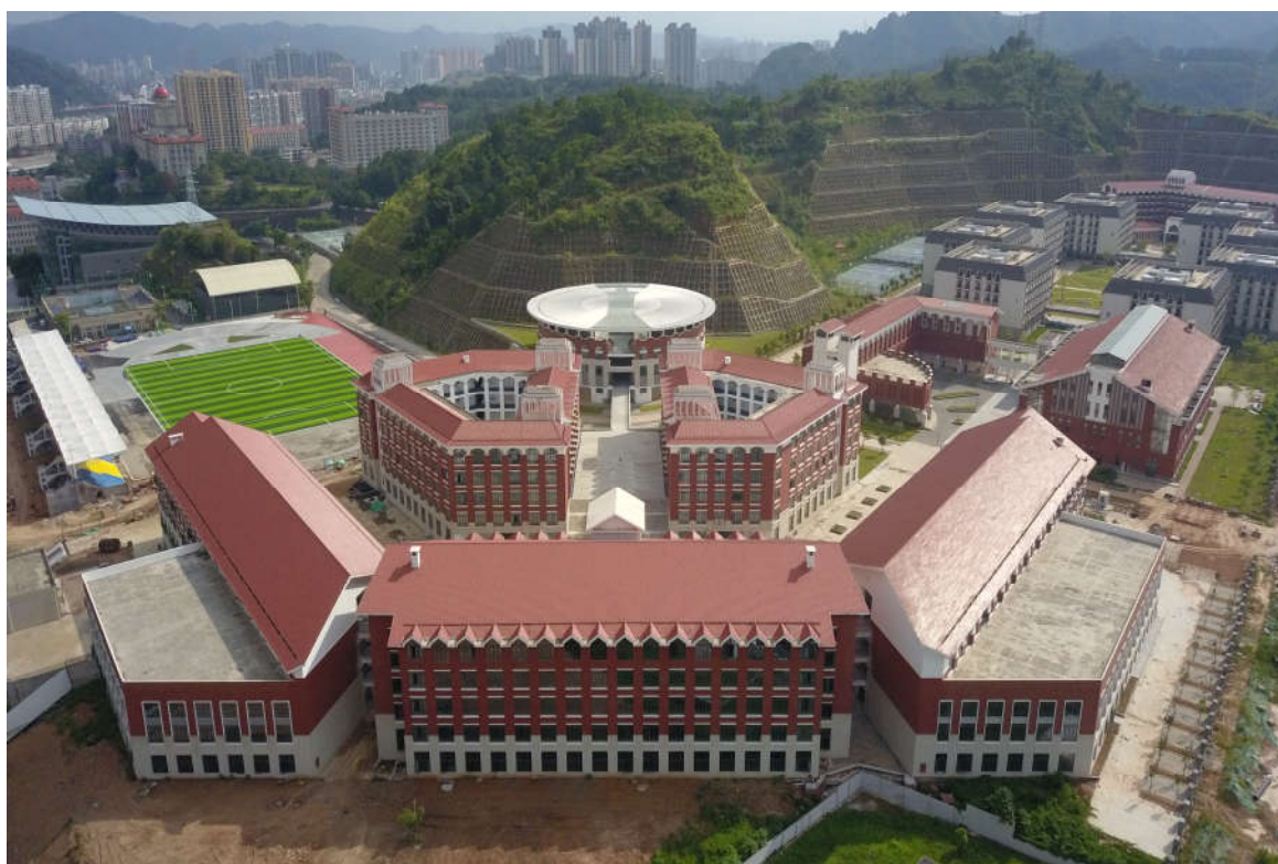
（1#综合教学楼、1#实验实训楼及 1#阶梯教室鸟瞰图）