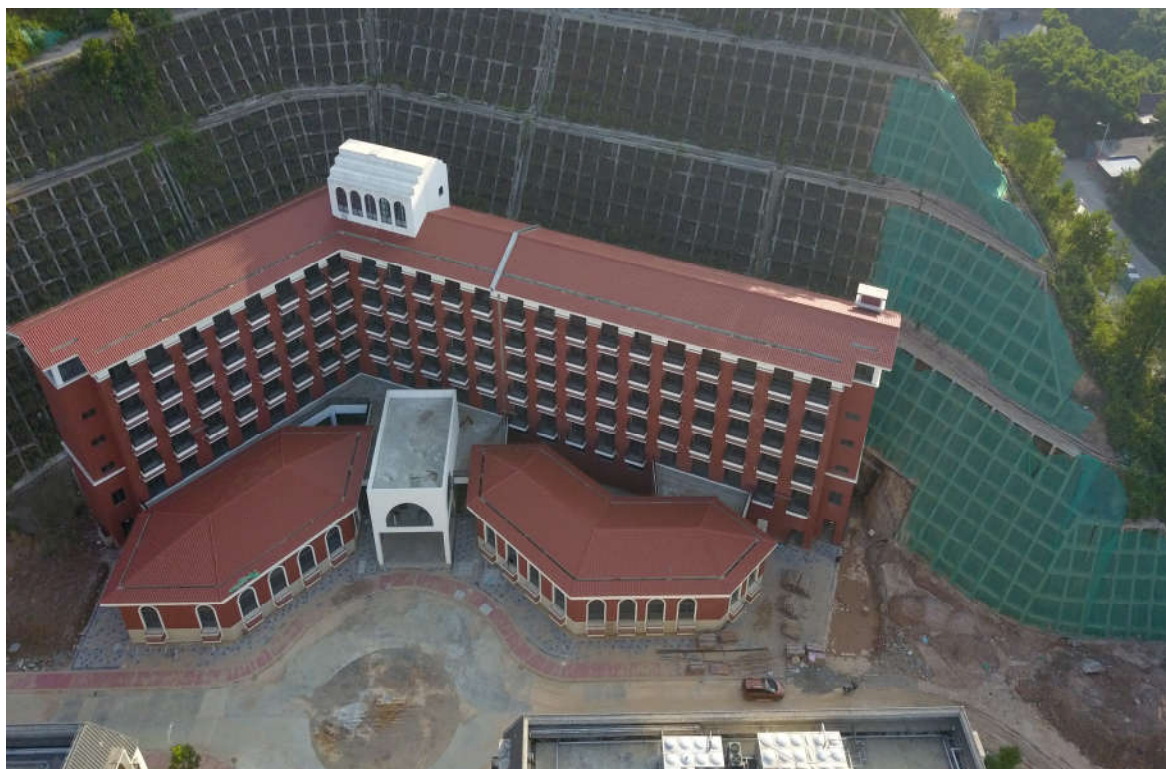
（三期 7#职业培训楼施工鸟瞰图）