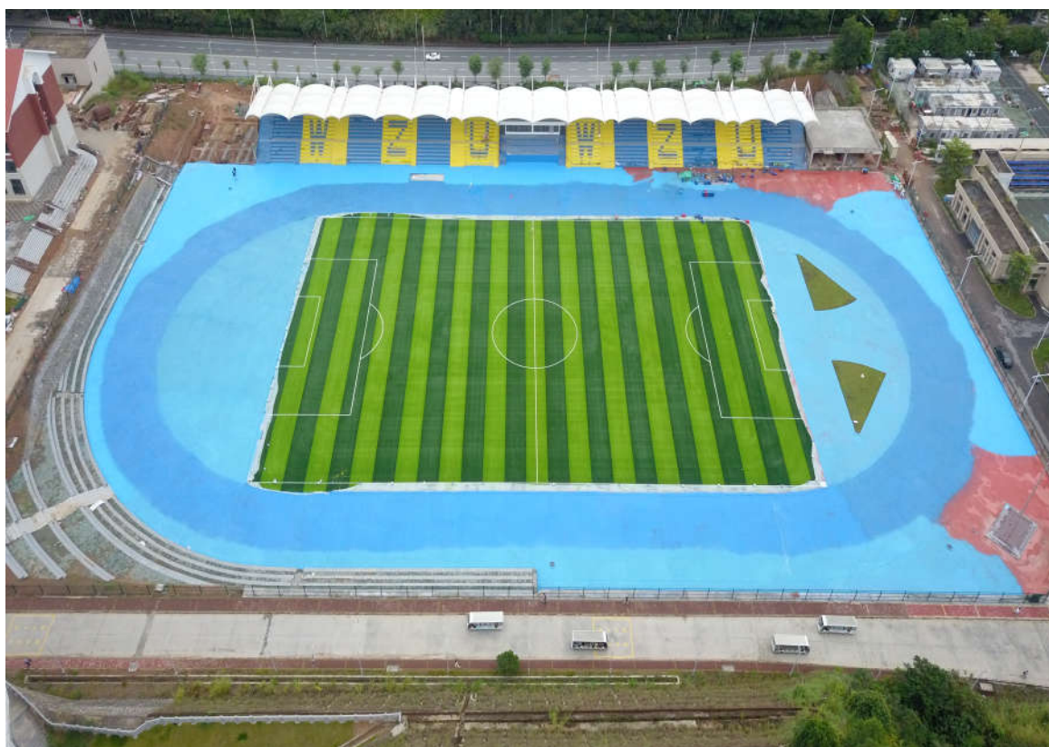
（三期室外运动场及体育看台的施工鸟瞰图）