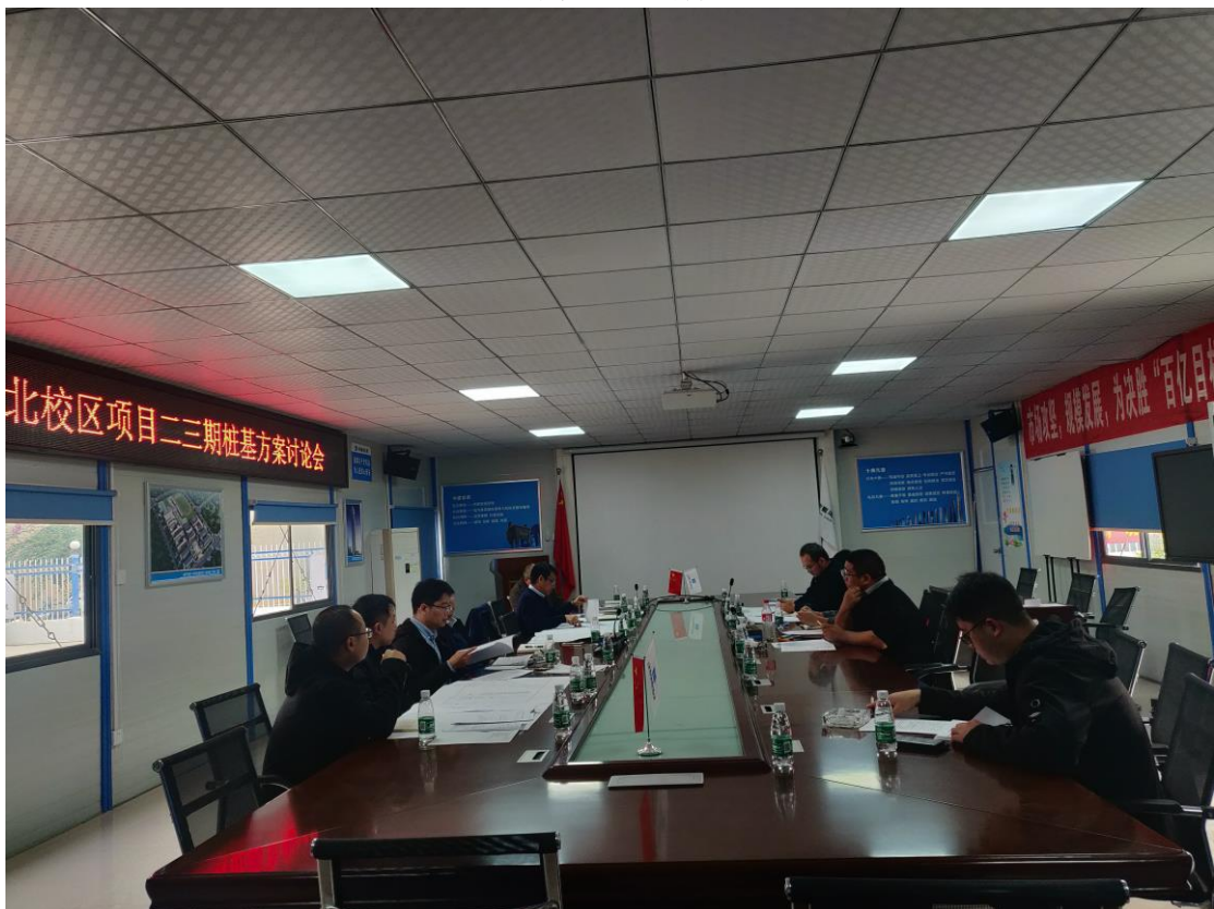
二三期桩基方案讨论会