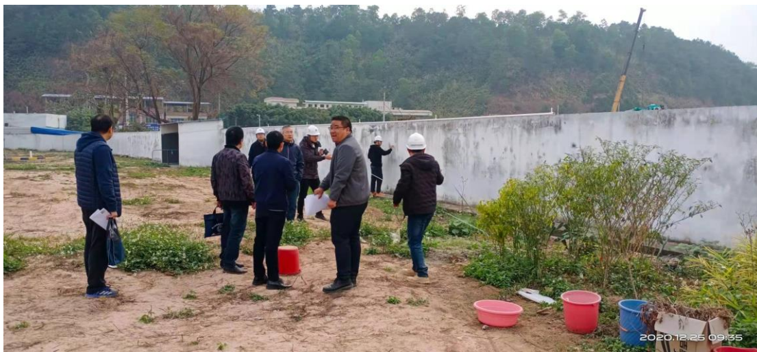
与加油站协调临时占地施工问题

3. 从 11 月 25 底至 12 月 25 日完成产值约 1727 万元，日产值平均约 57.57 万元，年度累计完成建安产值约 3.7822 亿元。