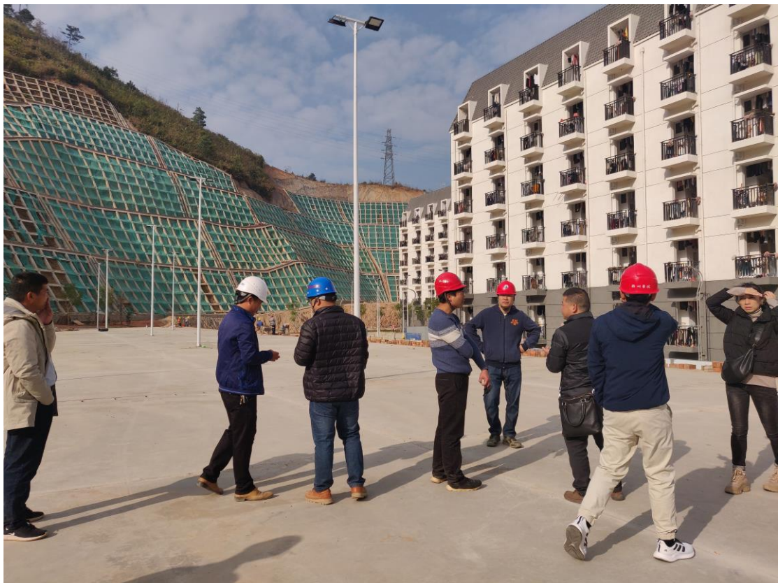
篮球架安装现场交底