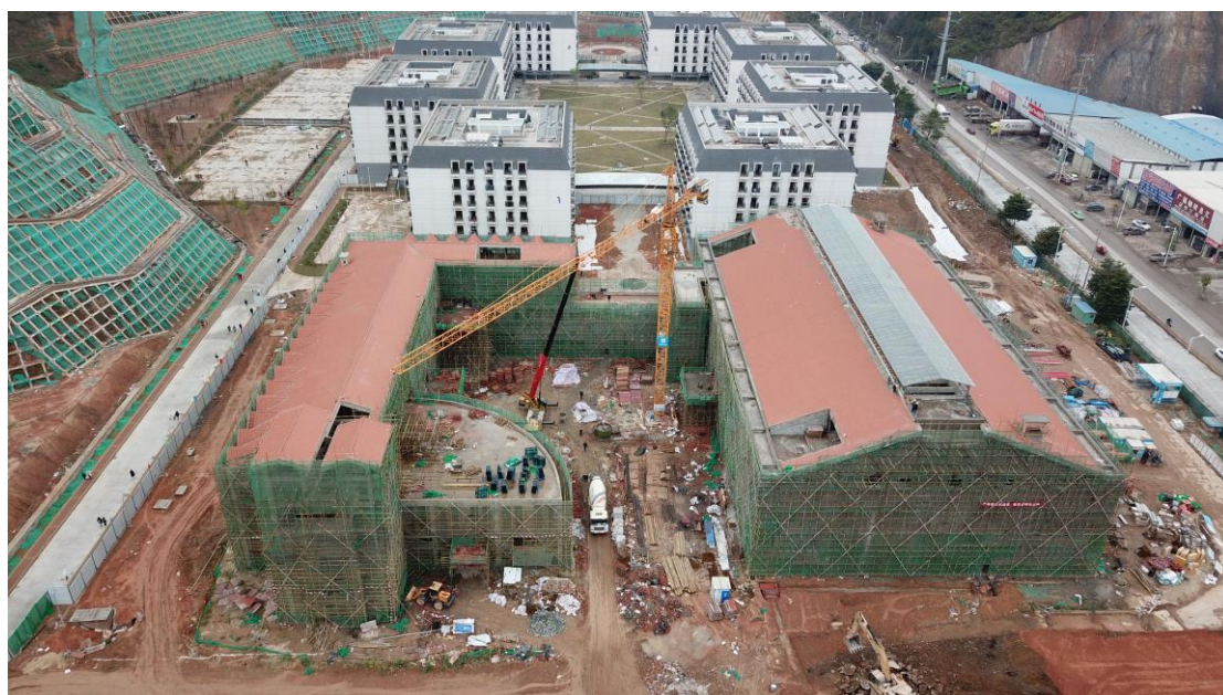
食堂综合楼鸟瞰图

二期施工场地平整基本完成，实验实训楼和教学楼之间的临时施工道路路基施工已完成，并做好喷淋系统预埋，临时用电布置以及教学楼西侧管道预埋工作正在开展。项目部组织开展了二三期桩基方案讨论会，就二三期桩基类型与数量的使用合理性进行了专题讨论。学校、施工方、中石化会同市应急局就涉及实验实训楼地下室地基开挖临时占用加油站土地问题进行了协调。