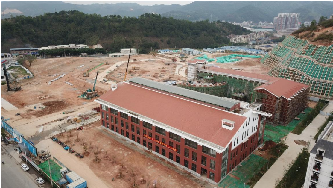
(食堂综合楼施工鸟瞰图)