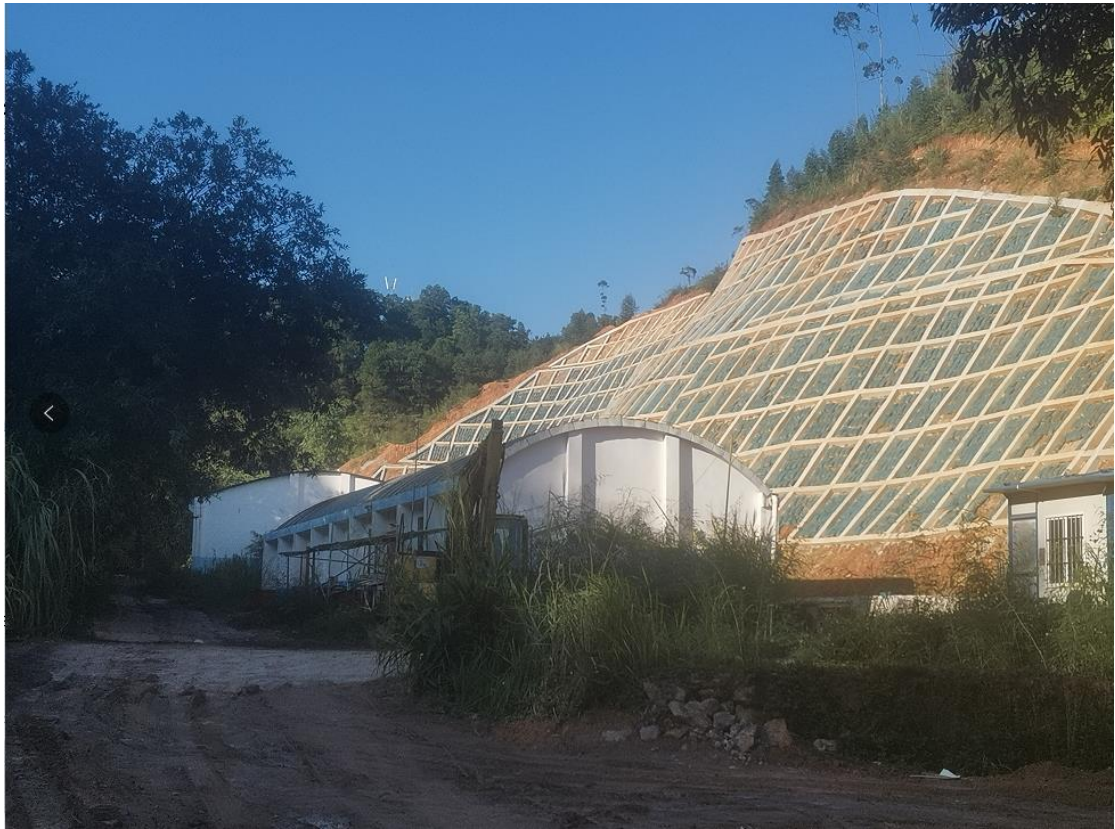
(旦冲地灾治理工程)