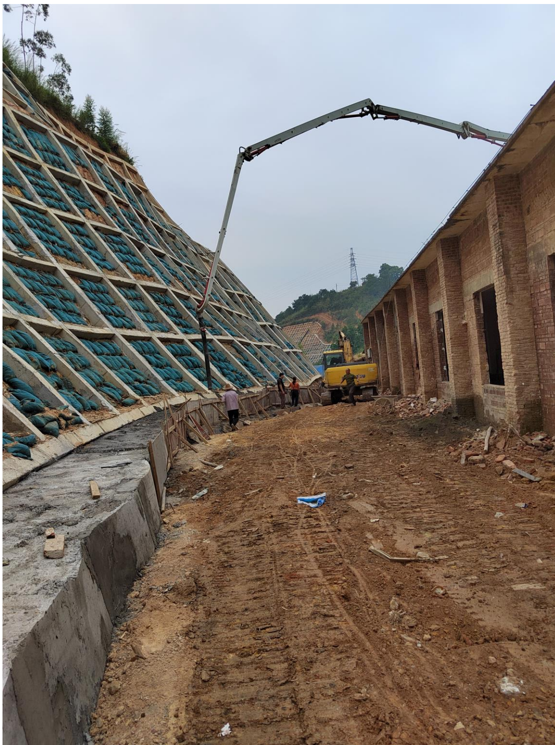
(旦冲地灾治理项目)